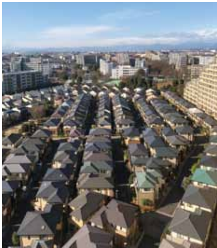
新興住宅地の戸建て住宅と マンション群