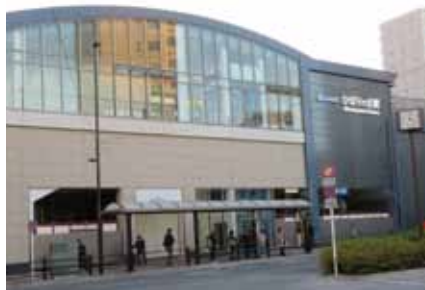
ひばりヶ丘駅北口

ひばりヶ丘駅北口のま ちづくりは、まだまだ続 きますが、これからも市 民の思いをくみ取って頂 きたいと思っています。